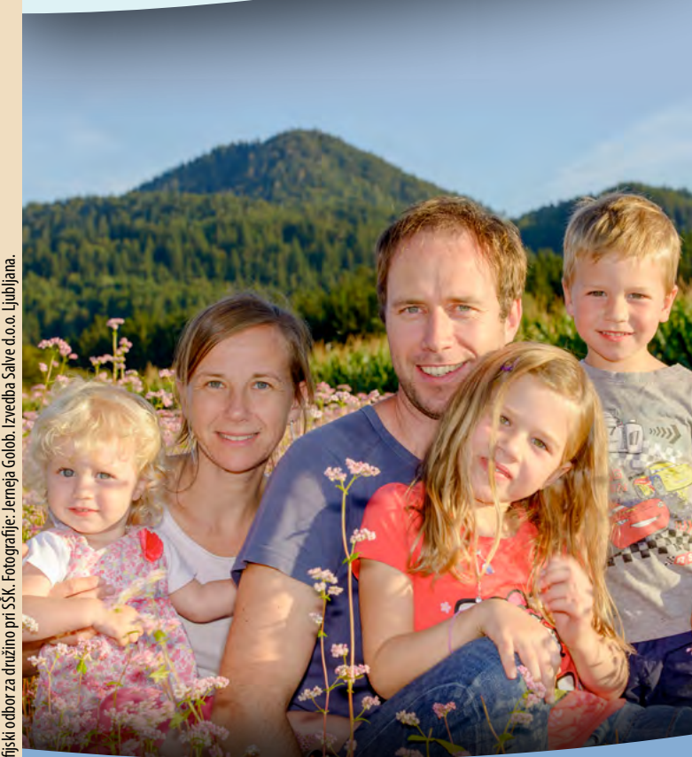
Izidal: Medškofjski odbor za družino pri SSK. Izvedba Salve d.o.o. Ljubljana.