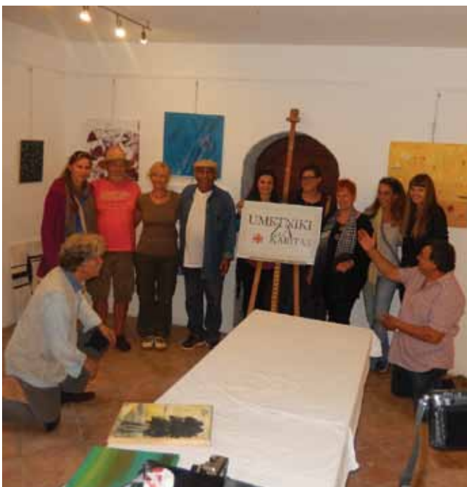
Prisega, da pridejo spet ...