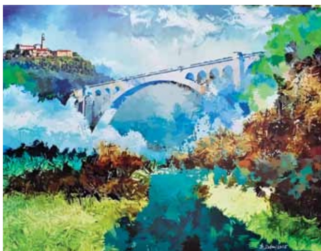
BOGDAN SOBAN Most, 2015 računalniška grafika