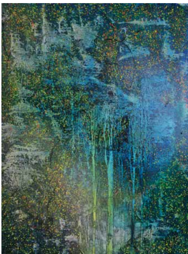
JANEZ ŠTROS Nevihta, 2015 olje na platnu