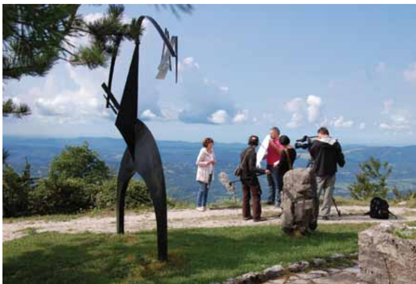
Ekipa televizije RAI, vsako leto zvesti ...