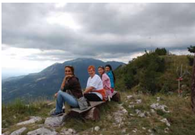
Razkošen pogled v dolino