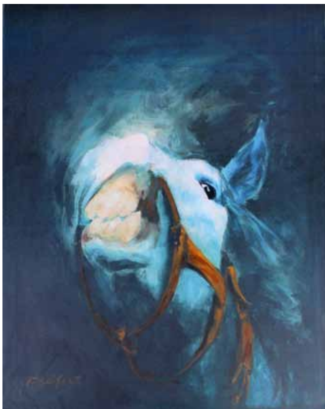
TONE SEIFERT Lipicanec, 2015 mešana tehnika