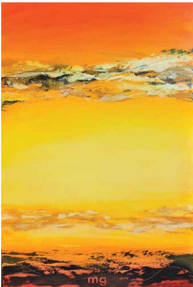
MILENA GREGORČIČ Valovanja 2, 2015 akril na platnu