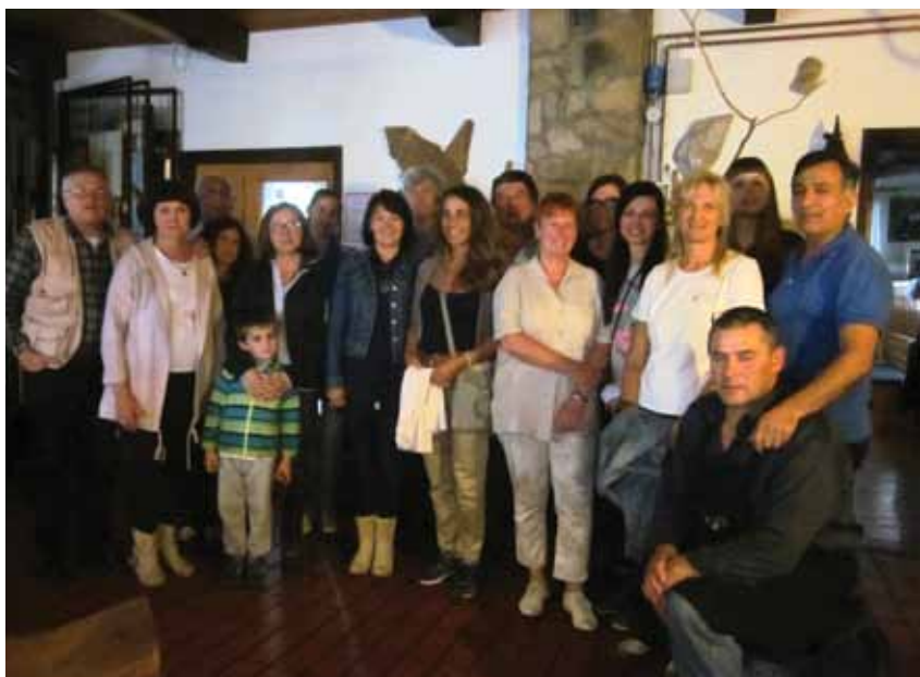
Sinji vrh, prvi deževen dan ...