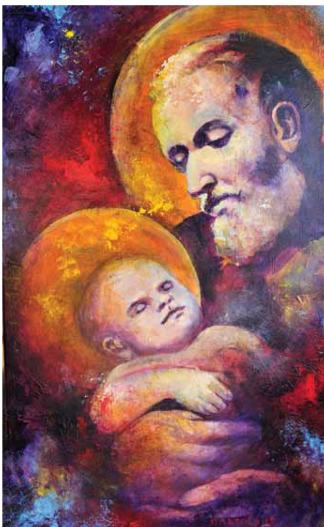
JOŽE BARTOLJ Sveti Jožef, 2015 akril na lesu