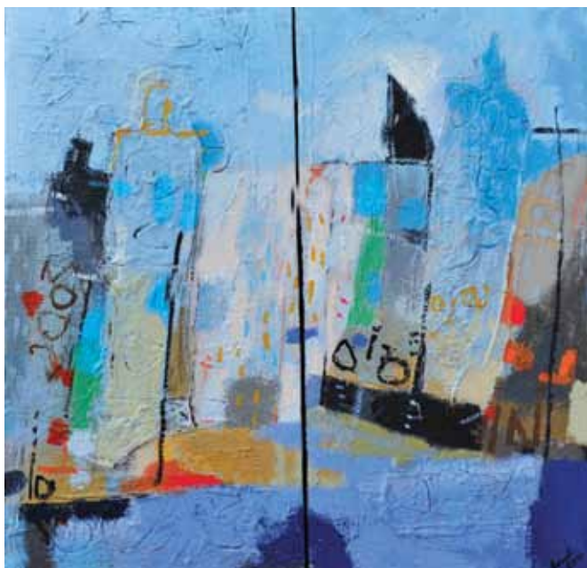
AZAD KARIM Tavanje, 2015 akril na platnu