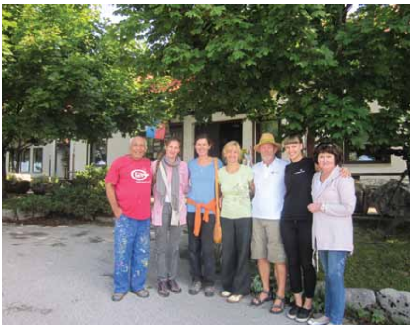
Drugi dan - sonce ...