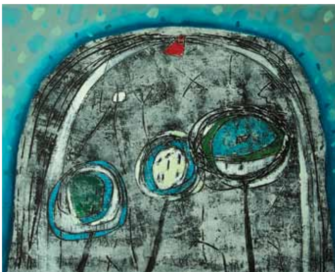
SILVA KARIM Drevesa, 2013 akril na platnu