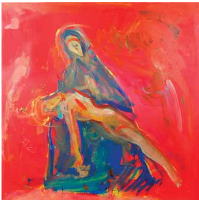
MIRA LIČEN KRMPOTIĆ Pieta akril na platnu, 2015