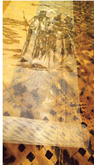
»POGLED SKOZI«, 2018 slikarska instalacija, akrilne pvc mreže in poslikave / installazione pittorica, reti in pvc acrilico e dipinti, 7 x à 100 x 150 cm