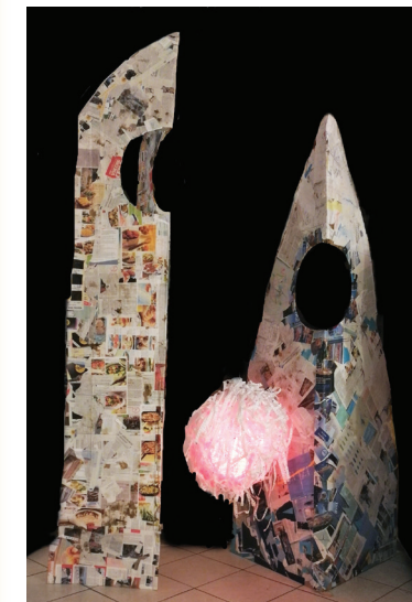
»DRUŽINA NA PUNTI«, 2018 lepljen karton in papir, akril, luči cartone incollato e carta, acrilico, luci, 200 cm x 300 cm

Martin Zelenko Poles, nato nel 1984 a Capodistria, vive e lavora a Isola. Si è laureato all'Accademia di Belle Arti di Lubiana presso il Dipartimento di Design e Comunicazione visiva. Si occupa di pittura, fotografia, illustrazione, grafica, video e montaggio, ancora prima di aver intrapreso e concluso gli studi. Si interessa anche di musica e film. Nel 2004 ha avuto la sua prima mostra personale alla Galleria Alga a Isola. Ha collaborato a numerose mostre personali e collettive in Slovenia, in Croazia, in Italia e in Lituania.