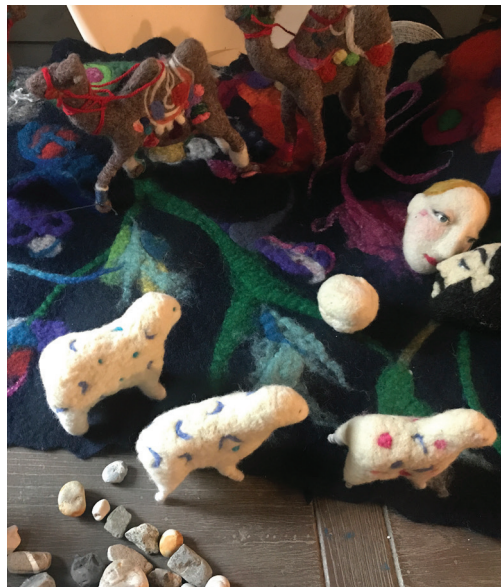
»JASLICE«, 2018 instalacija, mešana tehnika z volno installazione, tecnica mista con lana

Kateryna Burlina, nata nel 1977 a Kiev, vive e lavora a Isola. Ha frequentato il liceo artistico statale a Kiev e nel 2000 ha conseguito il diploma di laurea all'Accademia di Belle Arti di Kiev. Per le sue creazioni usa materiale diverso: carta, cartone, basi di legno. Cerca e scopre continuamente altri materiali e tecniche non convenzionali per i suoi lavori. Attualmente lavora il feltro e la lana.