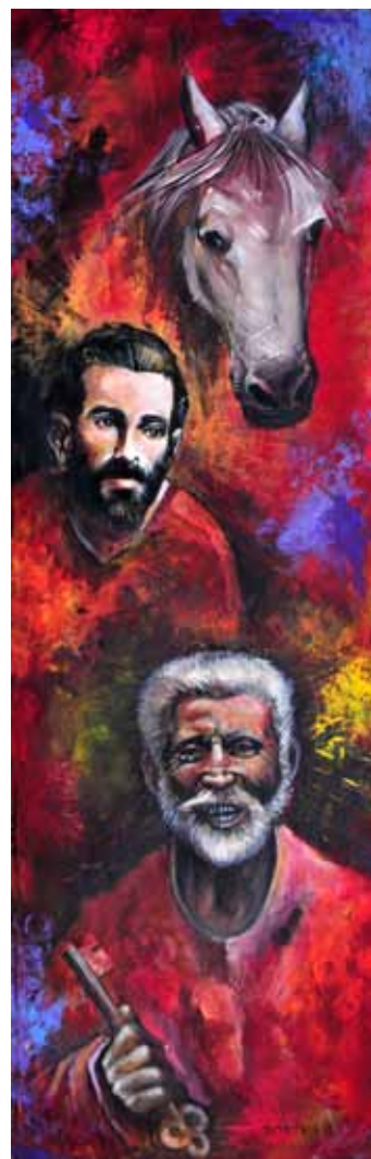
JOŽE BARTOLJ Sv. Peter in Sv. Pavel, 2018 akril na platnu