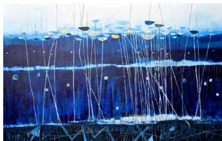
SILVA KARIM Ločje, 2019 akril na platnu