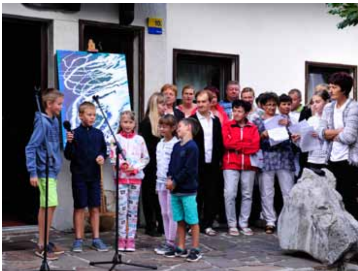
Pevci in igralci z Gore vsako leto popestrijo dan odprtih vrat