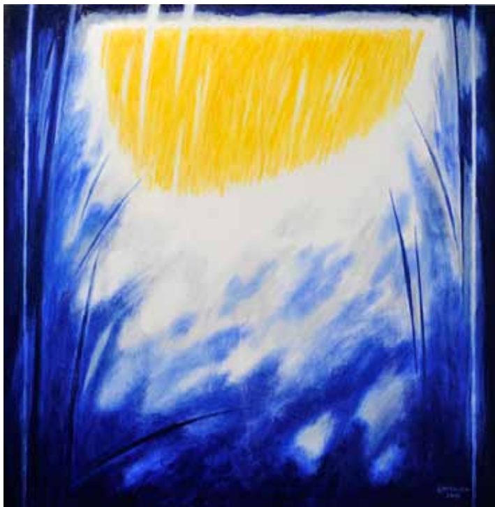
LOJZE ČEMAŽAR Gora - Sinji vrh, 2019 olje na platnu

Lojze Čemažar, ki živi in ustvarja v Ljubljani, je leta 1976 diplomiral na Akademiji za likovno umetnost v Ljubljani, tri leta kasneje pa zaključil še slikarsko specialko. Poleg klasičnih slik, za katere uporablja oljne barve, je tudi mojster vitražev in fresk.