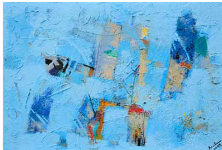
AZAD KARIM Dežela upanja, 2019 akril na platnu