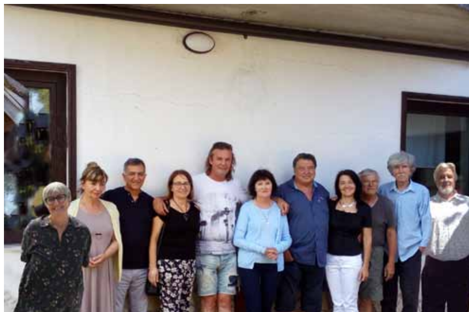
Strokovni sodelavci in pomočniki kolonije Umetniki za Karitas