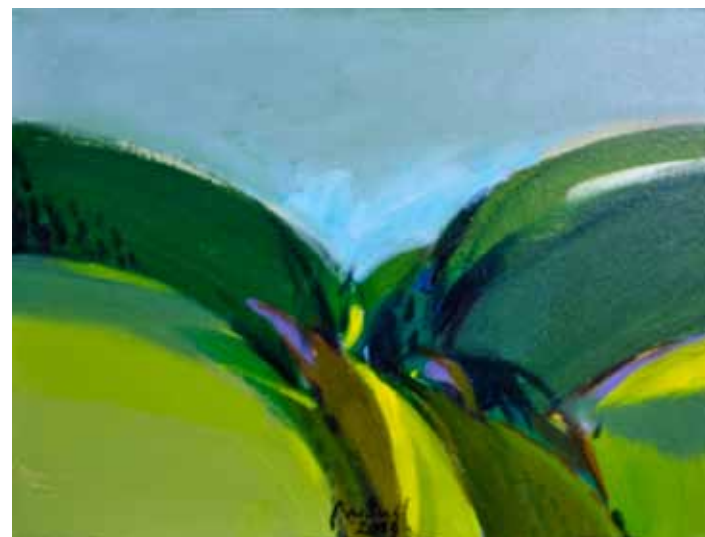
LUCIJAN BRATUŠ Gora, 2019 akril na platnu