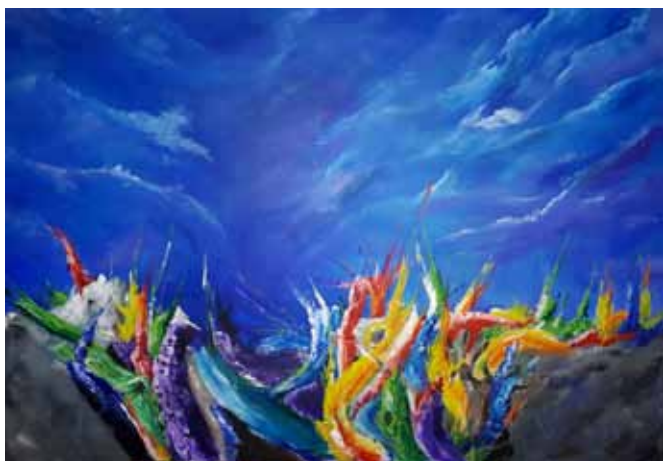
IGOR ZIMIC Meja nekaj neskončnega, 2019 akril na platnu