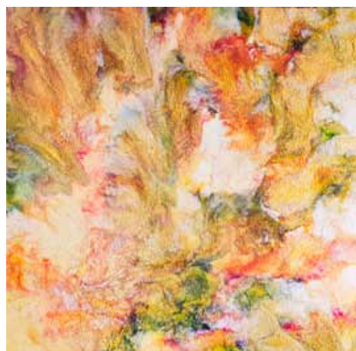
JANEZ ŠTROS Tudi ti si angel, 2019 tisk na platnu