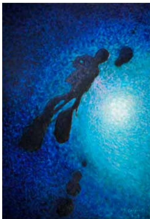
ANTON SEIFERT Iskalec, 2019 olje na platnu