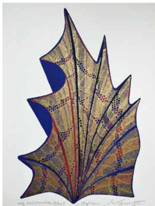
MILENA GREGORČIČ Spomini, 1996 orig. serigrafija