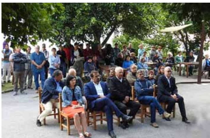
Obiskovalci in gostje ob dnevu odprtih vrat