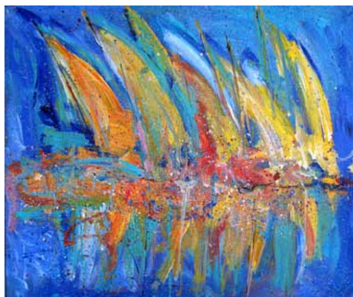
MIRA LIČEN KRMPOTIČ Regata, 2019 akril na platnu