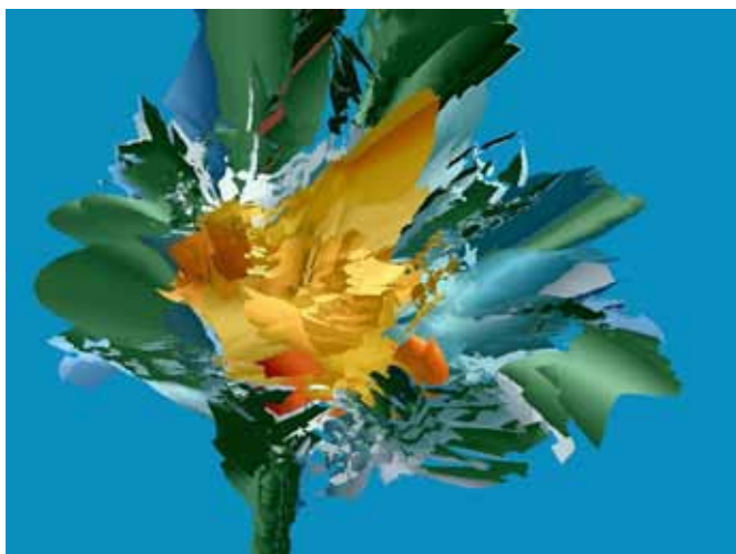
BOGDAN SOBAN Šopek, 2019 digitalni tisk na platno