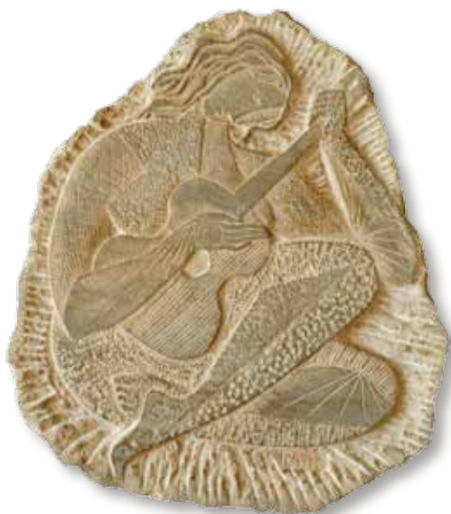
Stojan BATIČ (iz zapuščine DJ) Deklica s kitaro kamen