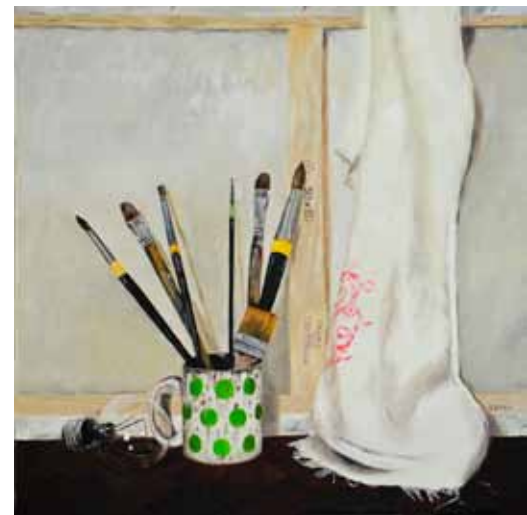
Silva KARIM Platno in sedem čopičev, 2020 olje na platnu