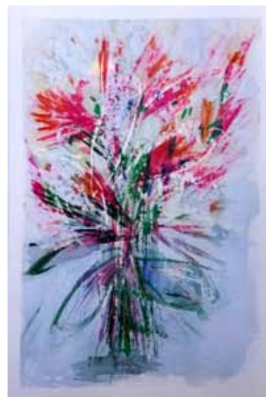
Črtomir FRELJH Šopek, 2020 mešana tehnika na papirju