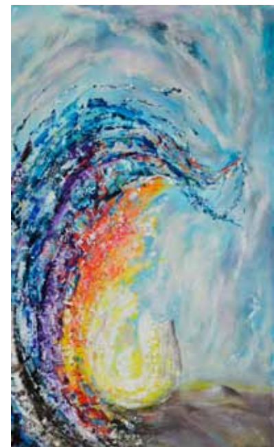
Igor ZIMIC Luč, 2020 akril na platnu