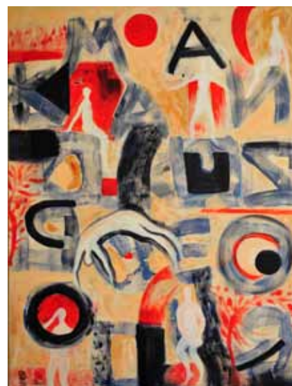
Lona VERLICH To je življenje, 2020 akril na platnu