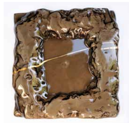
Mira LIČEN Pladenj, 2020 fuzija stekla s pozlato