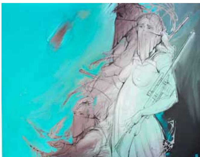
Nikolaj MAŠUKOV Maske, 2020 akril na platnu