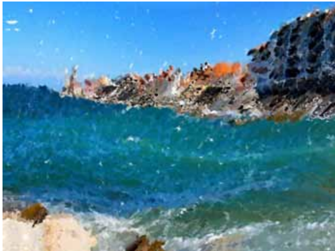
BOGDAN SOBAN Pred nevihto, 2020 digitalni tisk na platnu