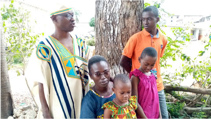
Julie in Gérard z otroki

https://katoliska-cerkev.si/oznaka/leto-druzine